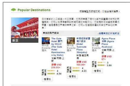
【樂吃購(ラーチーゴー)！東京 ホテル検索サイト 画面イメージ】