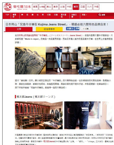
【岡山・ジーンズストリートの紹介記事】

「ラーチーゴー！日本」では今までも山陽・山陰地方の情報を発信してきましたが、今回の山陽・山陰版オープンにより、今後は同エリアに絞った情報検索をすることが可能になります。オープンに際し、 現在は人気記事である「岡山駅の攻略法」、「尾道エリアの紹介」、「広島三大アイコンの紹介(折り鶴、カープ、おたふく)」、「岡山ジーンズストリートの紹介」、「鳥取砂丘の紹介」 などを紹介しており、今後地元記事をより充実させていく予定です。